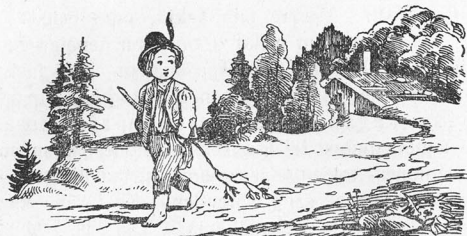
1 medį drožinėtas vaizdelis pagal piešinėlį dailininko Franz Pocci.

Buvom zadėje vaizdelius į "Jaunimą" dėti. Nega-lėjome. Norėjome paduoti Lietuvii dailininkū darbus, o jų ligšol nesuilaukėme. Emėme pasiprāše todēl šijį iš ge-riaušiojo Vokietšii dailēs laikraššio vardu "Kunstwart"). Ten tas vaizdelis Sale kitū minėtoju dailininko paduotas, kadangi jie išleidėjui taip labai patike.