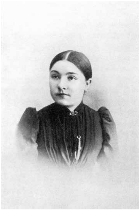
M. R. bûdama 18- mt.