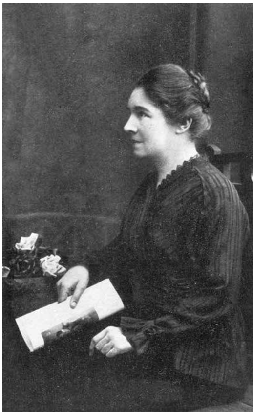
M. R. bûdama 43- mt.