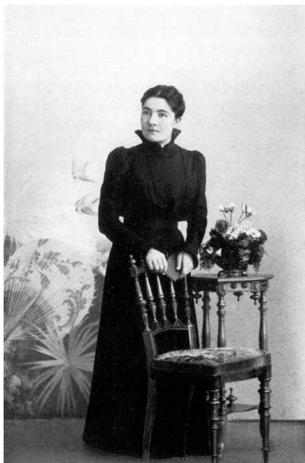
M. R. búdama 28- mt.