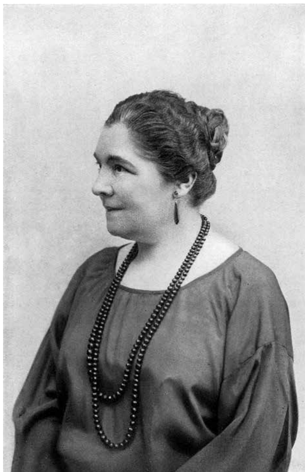
M. R. bûdama 53- mt.