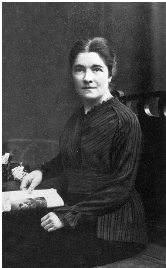
M. R. bûdama 43- mt.