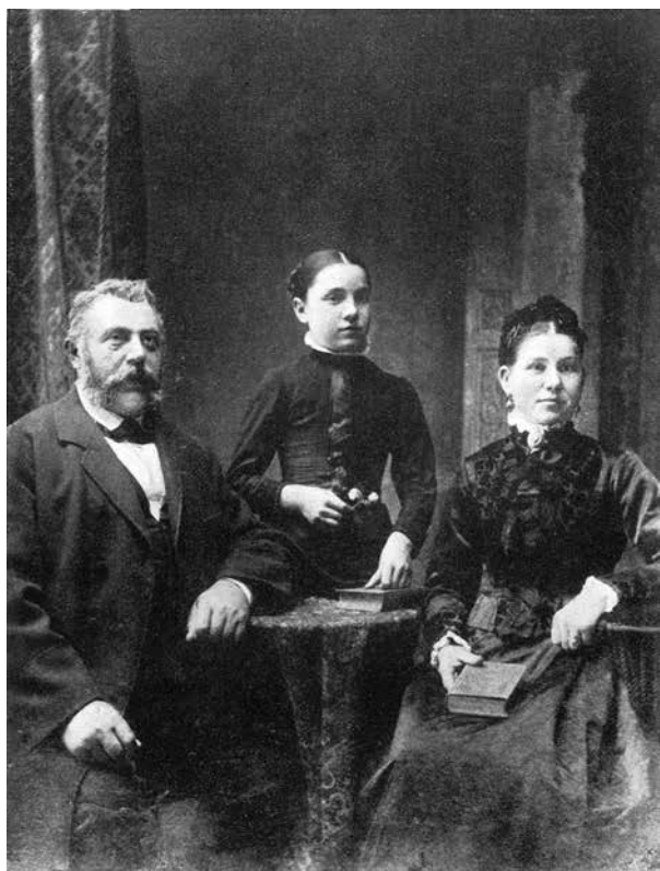
M. R. su savo tēvais, ižegnotuvēs dienā, būdama 14- metū.